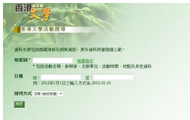
圖 4：香港文學活動搜尋搜尋介面。

「香港文學活動搜尋」資料庫的結構大致不變，只更改了部份欄目的名稱[註11]，卻擴大了收集資料的範圍，不再侷限於紙本海報，只要是來自主辦機構或可靠的訊息來源，不論透過哪種媒介（包括主辦機構網站、Facebook 等），經核實後一概收錄。另外，「香港文學活動搜尋」從既有資料入手，補充歷時資料的缺漏。「香港文學活動搜尋」從黃繼持、盧瑋鑾、鄭樹森主編的《香港文學大事年表（1948–1969）》及何慧姚主編的《香港文學年表（1990–2000）》匯入資料，藉此呈現更為整全的文學活動面貌，方便研究者沉鈞香港文學的歷史。