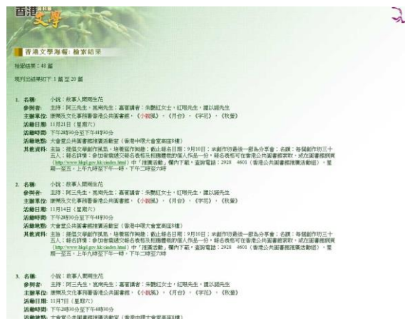
圖3：香港文學海報搜尋搜尋結果示例。

「香港文學海報搜尋」主要針對海報的文字資料，將所有海報文稿統一格式，按「活動名稱」、「參與者」、「主辦單位」、「活動時間」、「地點」及「其他資料」分列。讀者可以「檢索詞」(包括上述六個欄位)、「資料來源」及「日期」查詢，搜尋系統支援「，」代替「OR」、「&」代替「AND」兩組運算元(Boolean Operators)的應用，搜尋結果可選擇按順時或逆時排序(圖3)。