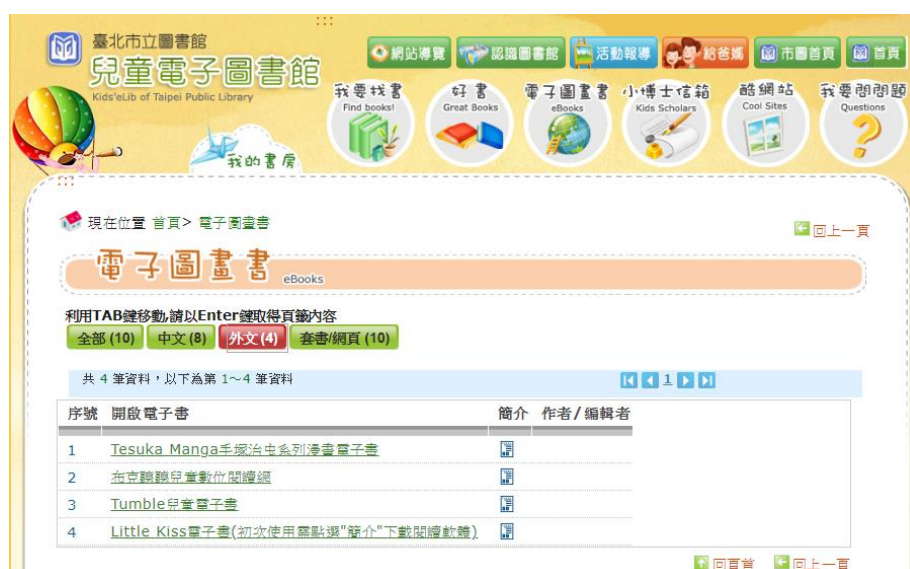
圖 1 臺北市立圖書館兒童電子圖畫書首頁

資料庫具有分類圖書（伴讀自學）、有聲書、翻頁書、小遊戲等特色。另外，布克聽聽兒童數位閱讀網則有分類圖書（伴讀自學、圖書類型、閱讀時間）、故事動畫、鮮明之翻頁書等特色；咕嚕熊共讀網電子書則具備翻頁書、故事動畫、問題反思等特色。各個商業平臺提供的資源提供不同之設計特色，公共圖書館透過不同平臺電子書的館藏建置，讓讀者有更多元的探索體驗，選擇適合的電子書。