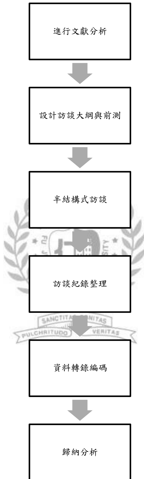
圖 2 研究流程圖